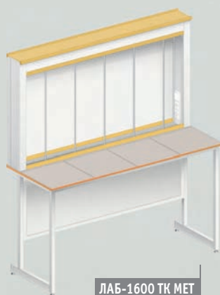
ЛАБ-1600 ТК МЕТ