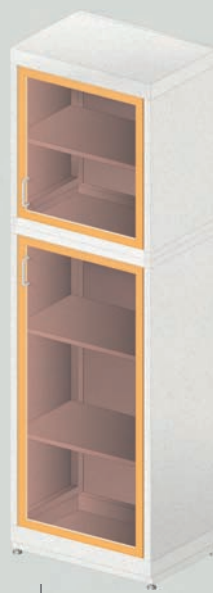
ЛАБ-600 ШП МЕТ