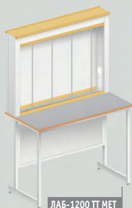
ЛАБ-1200 ТТ МЕТ