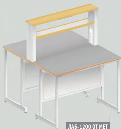
ЛАБ-1200 ОТ МЕТ