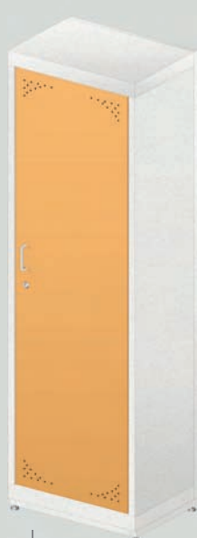
ЛАБ-600 ШО МЕТ