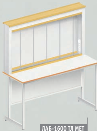
ЛАБ-1600 ТЛ МЕТ