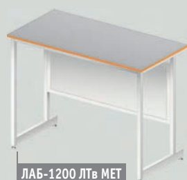
ЛАБ-1200 ЛТв МЕТ