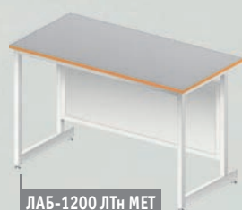
ЛАБ-1200 ЛТн МЕТ