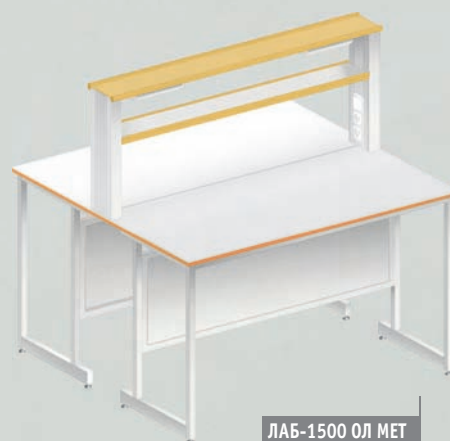
ЛАБ-1500 ОЛ МЕТ