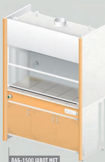
ЛАБ-1500 ШВОТ МЕТ