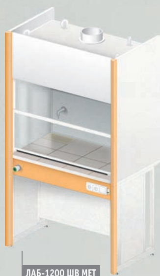
ЛАБ-1200 ШВ МЕТ