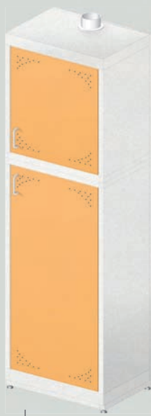
ЛАБ-600 ШР МЕТ