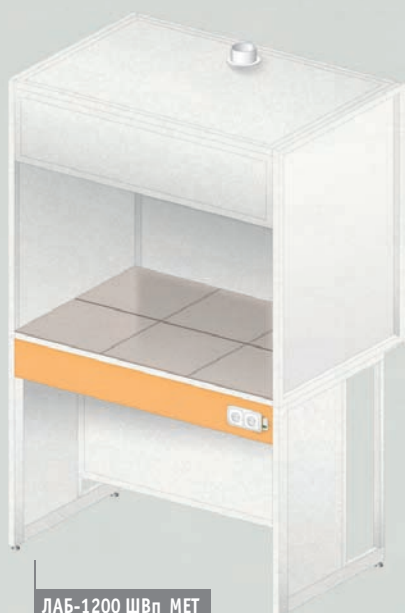
ЛАБ-1200 ШВп МЕТ