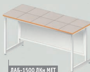
ЛАБ-1500 ЛКн МЕТ