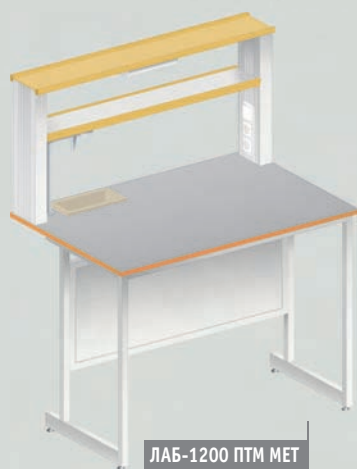
ЛАБ-1200 ПТМ МЕТ