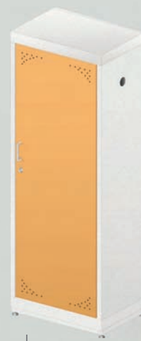
ЛАБ-600 ШБ МЕТ