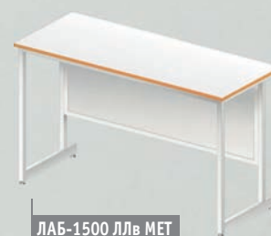
ЛАБ-1500 ЛЛв МЕТ