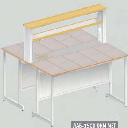
ЛАБ-1500 ОКМ МЕТ