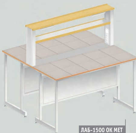
ЛАБ-1500 ОК МЕТ