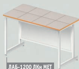
ЛАБ-1200 ЛКн МЕТ