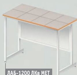
ЛАБ-1200 ЛКв МЕТ