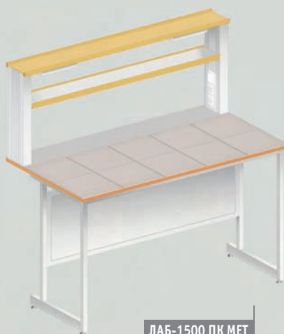
ЛАБ-1500 ПК МЕТ