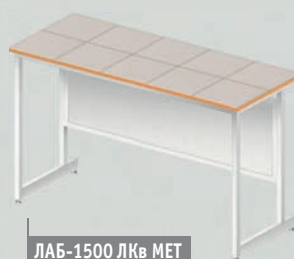
ЛАБ-1500 ЛКв МЕТ