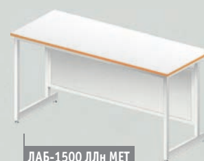
ЛАБ-1500 ЛЛн МЕТ