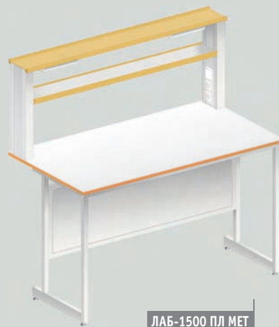
ЛАБ-1500 ПЛ МЕТ