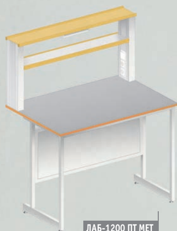
ЛАБ-1200 ПТ МЕТ