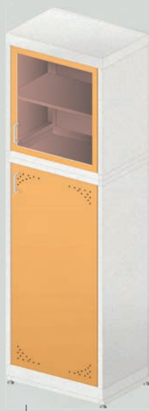
ЛАБ-600 ШД МЕТ