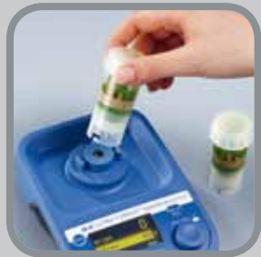
ШАГ 7 Пробирка снимается с прищипки.