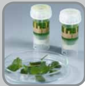
ШАГ 8 Результат: листья мяты диспергированы в однородную массу.