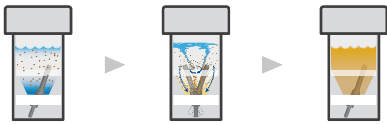
жидкость + порошок