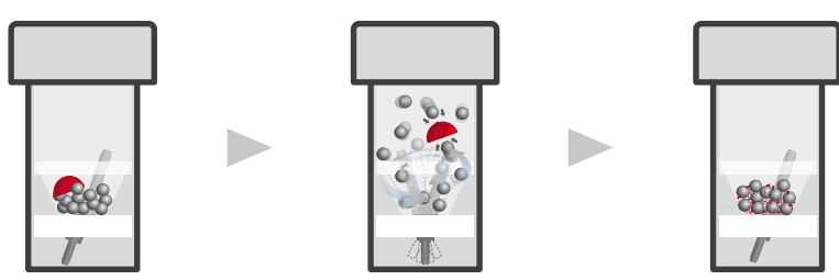
шарики + проба