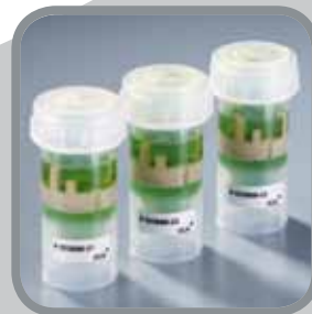
ШАГ 10 Пробирка маркируется и хранится в качестве контрольной пробы.