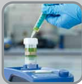
ШАГ 9 При необходимости пробу можно извлечь при помощи шприца через проницаемую мембрану пробирки.