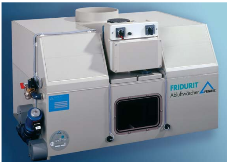
Скруббер Fridurit C90

Скрубберы Fridurit C90 и C54 устанавливаются непосредственно на вытяжной шкаф, в то время как C75 и C180 предназначены для напольного или настольного размещения рядом с тягой.