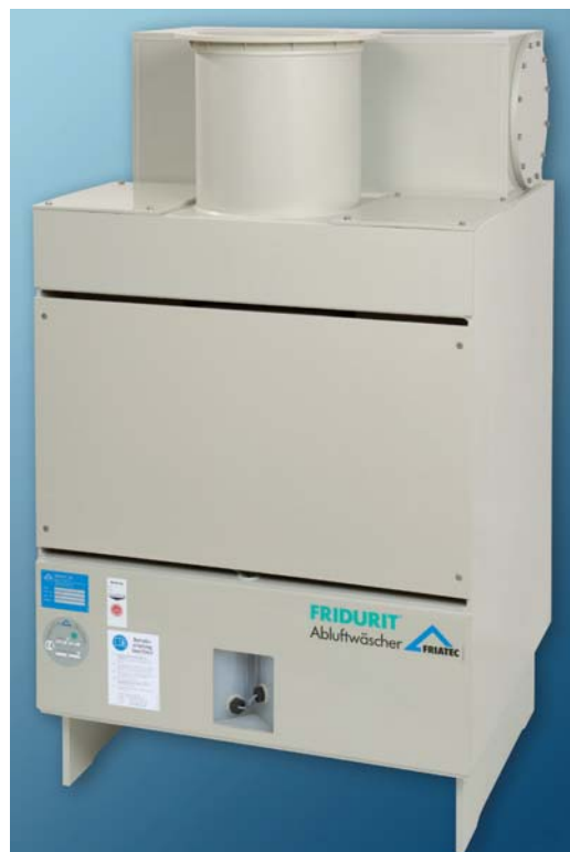
Скруббер Fridurit C180