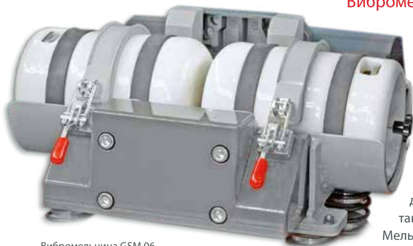
Вибромельница GSM 06

Вибромельница GSM 06 служит для тонкого измельчения хрупких и волокнистых материалов.