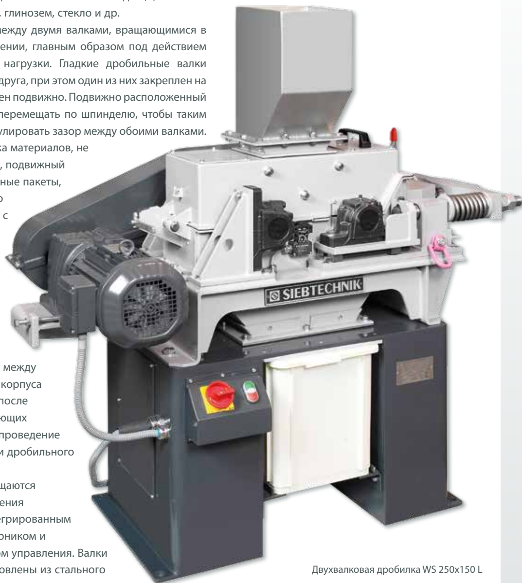
Двухвалковая дробилка WS 250x150 L

Мельницы модели WS оснащаются защищенным от проникновения загрузочным желобом, интегрированным в основную раму пробосборником и встроенным в корпус блоком управления. Валки мельницы могут быть изготовлены из стального литья, карбида вольфрама и оксида циркония.