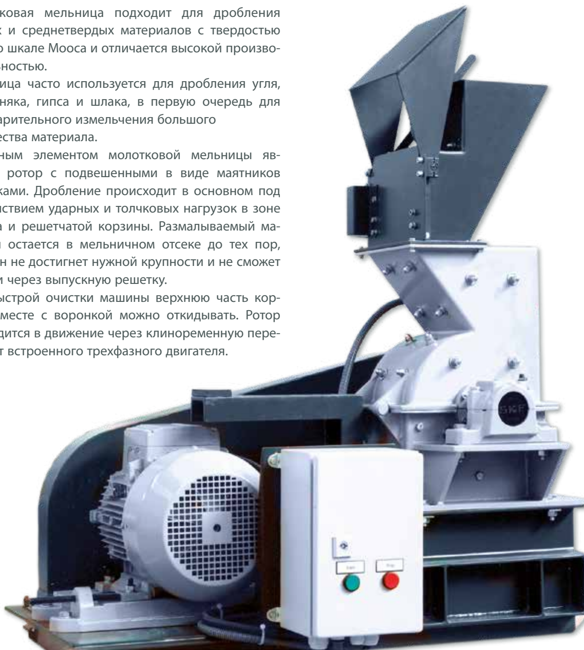
Молотковая мельница НМ 1 с загрузочной воронкой и блоком управления

Для быстрой очистки машины верхнюю часть корпуса вместе с воронкой можно откидывать. Ротор приводится в движение через клиноременную передачу от встроенного трехфазного двигателя.