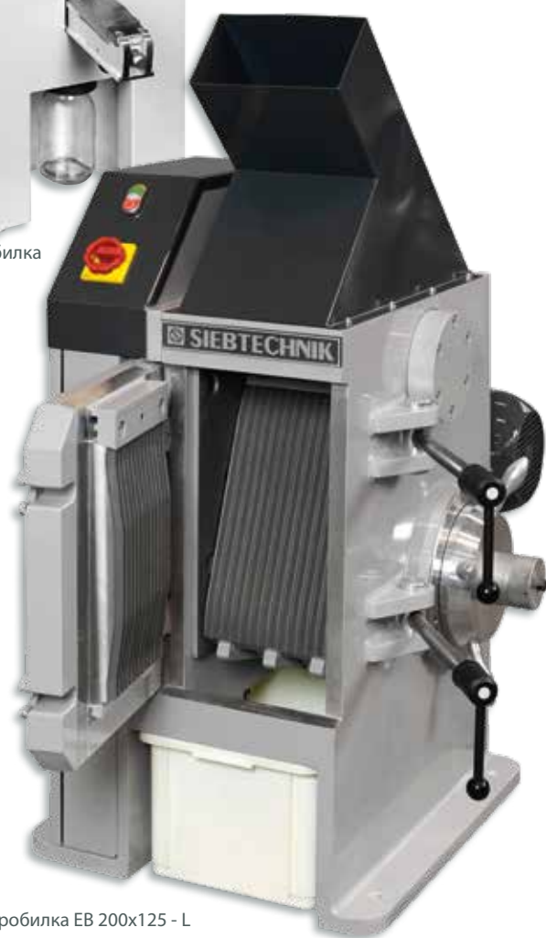
Щековая дробилка EB 200x125 - L