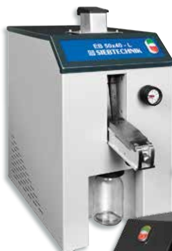
Щековая дробилка EB 50 x 40 - L