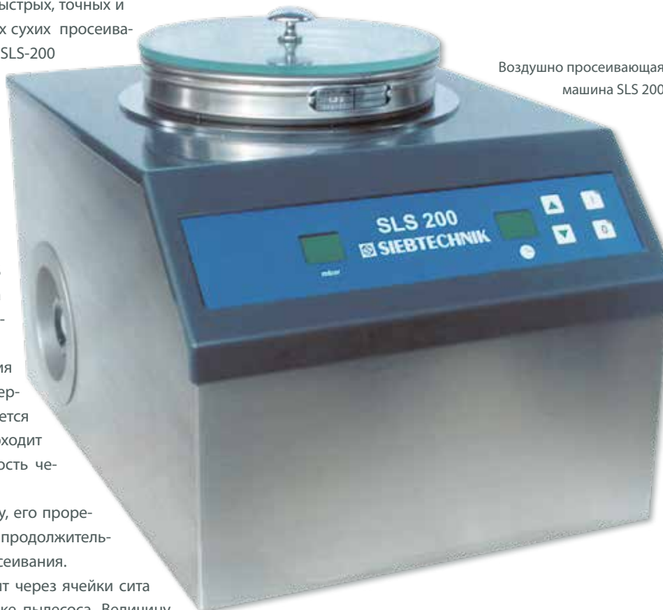
Воздушно просеивающая машина SLS 200

Подсоединение к сети, патрубков для подсоединения пылесоса и аппаратная розетка находятся на тыльной стороне.