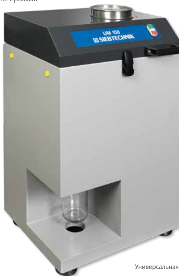
Универсальная мельница UM 150