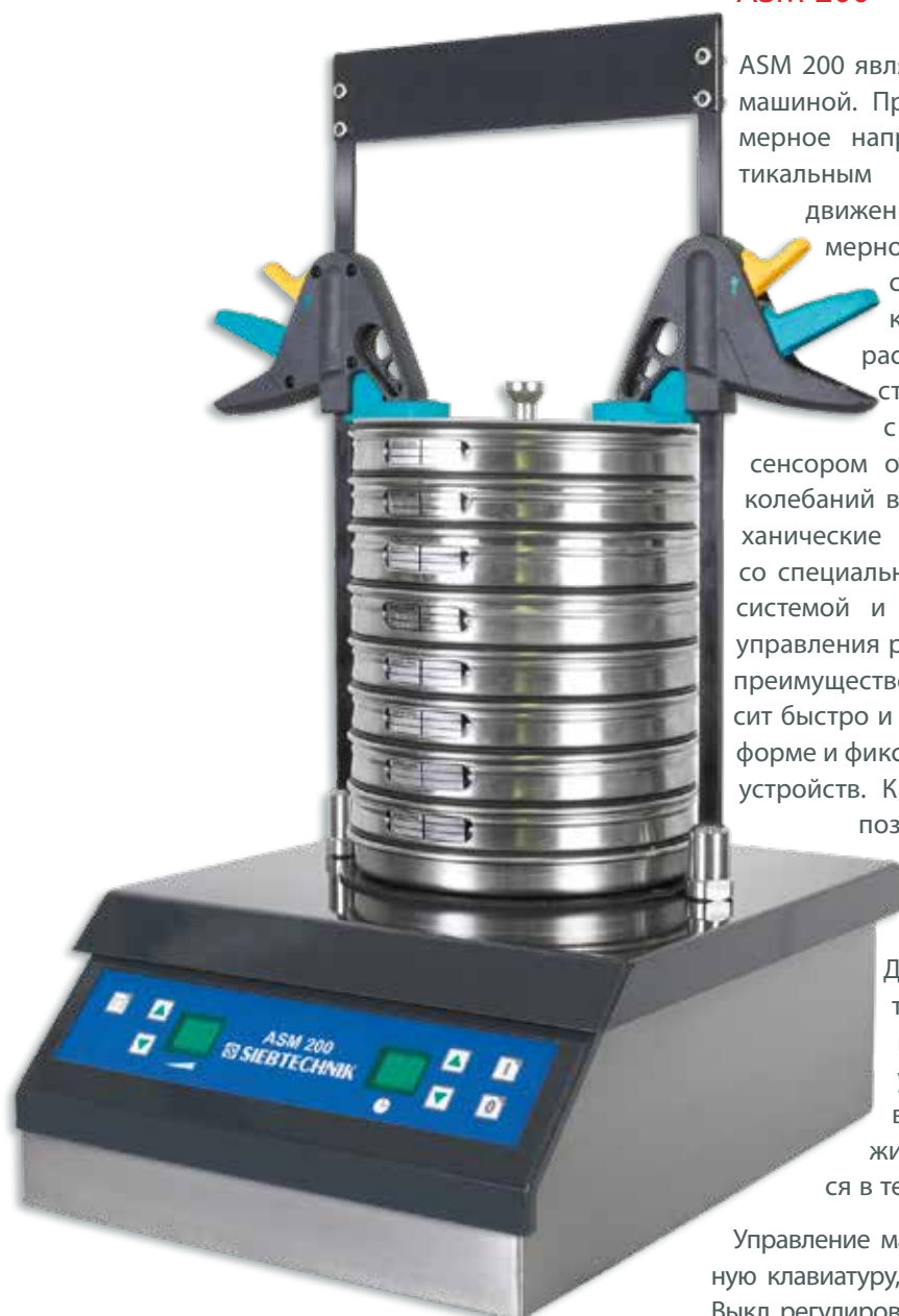
Лабораторная просеивающая машина ASM 200

ASM 200 является гравитационно-просеивающей машиной. Просеивающие движение имеет трехмерное направление с преимущественно вертикальным ускорением. В результате такого движения просеиваемый материал равномерно распределяется по поверхности сита, а интенсивные вертикальные колебания обеспечивают быстрый рассев. Инновационная электронная система управления ASM 200 в сочетании с установленным на виброплатформе сенсором обеспечивает постоянную амплитуду колебаний вне зависимости от нагрузки. Все механические детали, электромагнитный привод со специально настроенной двойной пружинной системой и электронные компоненты системы управления размещены в корпусе, изготовленном преимущественно из нержавеющей стали. Набор сит быстро и легко устанавливается на виброплатформе и фиксируется с помощью быстрозажимных устройств. Крышка из прозрачного плексигласа позволяет контролировать процесс просеивания. На машине ASM 200 возможно проведение мокрого просеивания.