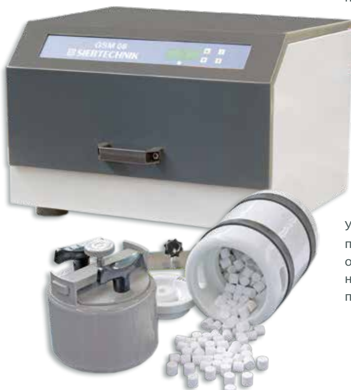
Стальная и керамическая помольные камеры с мелющими шарами

Управление машиной осуществляется с помощью пленочной клавиатуры, которая расположена на откидной крышке корпуса и имеет клавиши включения/выключения и регулировки продолжительности помола.