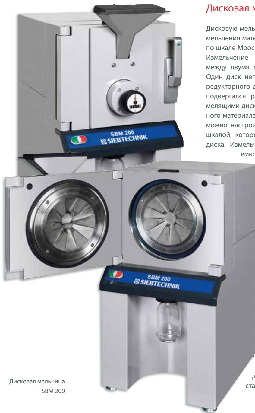
Дисковая мельница SBM 200

Дисковую мельницу можно использовать для мелкого измельчения материалов от мягких до твердых с твердостью по шкале Мооса до 8.