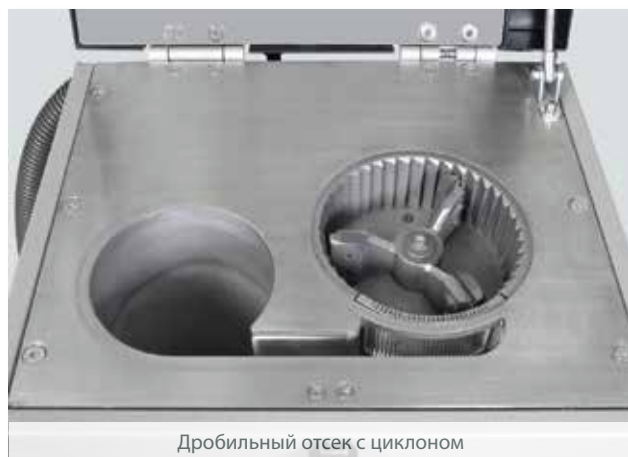
Дробильный отсек с циклоном

Крупность помола определяется шириной щели разгрузочной решетки, которая легко вставляется в соответствующий разрез дробильного отсека.