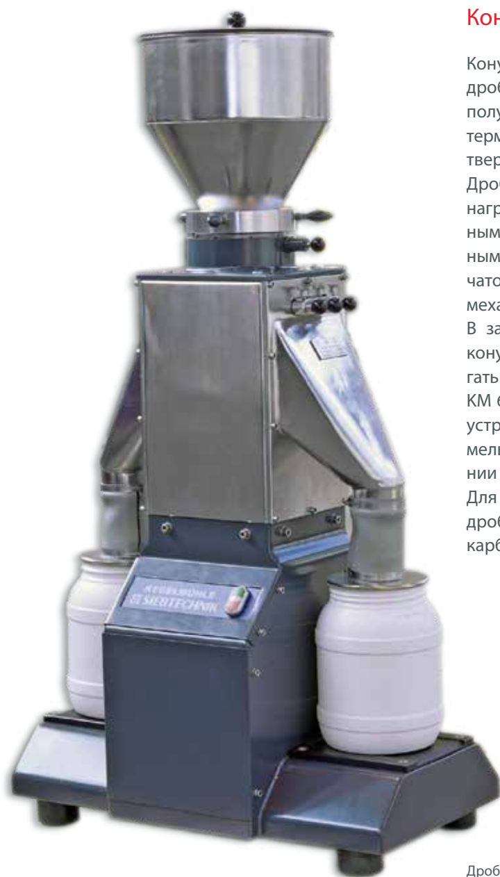
Конусная мельница КМ 65 с делителем

Для обеспечения долгой и безаварийной работы дробильный механизм мельницы выполнен из карбида вольфрама.