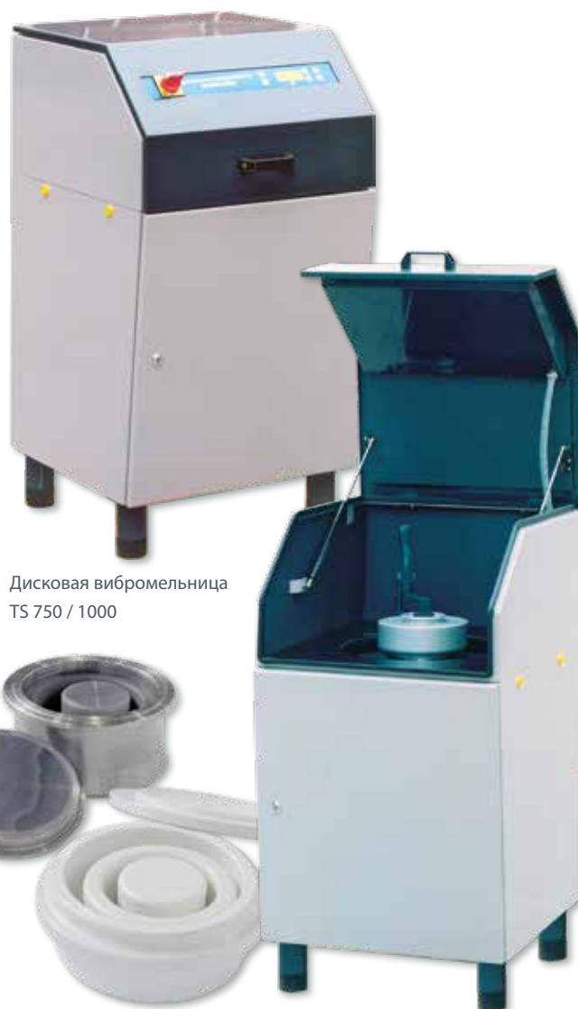
Дисковая вибромельница TS 750 / 1000