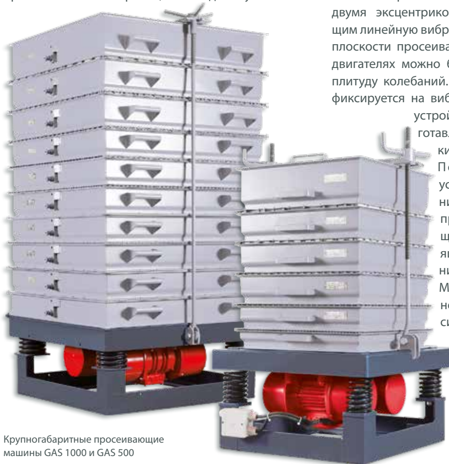
Крупногабаритные просеивающие машины GAS 1000 и GAS 500

Машины GAS 500 и GAS 1000 можно использовать без набора сит в качестве вибростолов.