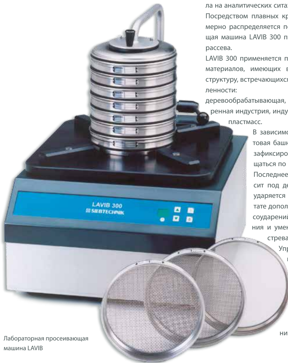
Лабораторная просеивающая машина LAVIB

Управление машиной осуществляется с помощью клавиатуры, на которой расположены клавиши включения/выключения и таймер времени. Большой вес машины обеспечивает ее ровный ход и устойчивость в работе. LAVIB 300 не требует технического обслуживания.