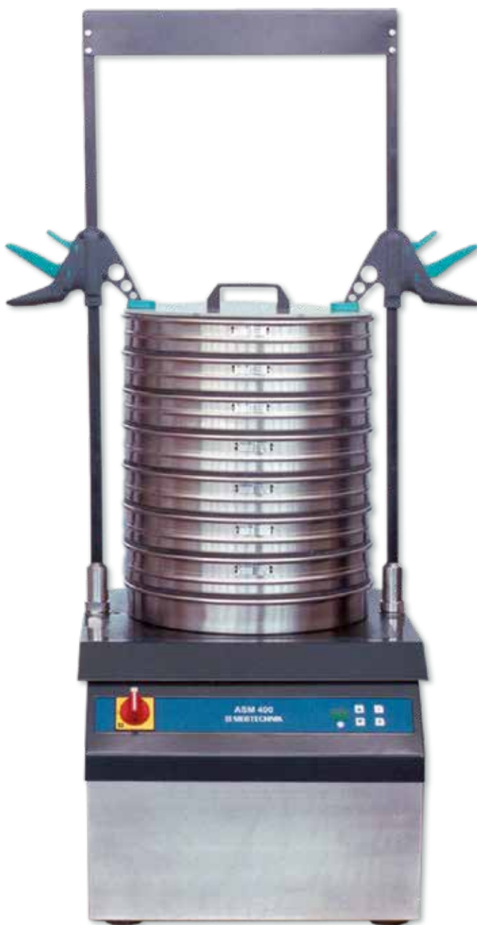
Лабораторная просеивающая машина ASM 400

Управление машиной осуществляется через пленочную клавиатуру, на которой размещены клавиши Вкл/Выкл и продолжительности просеивания.